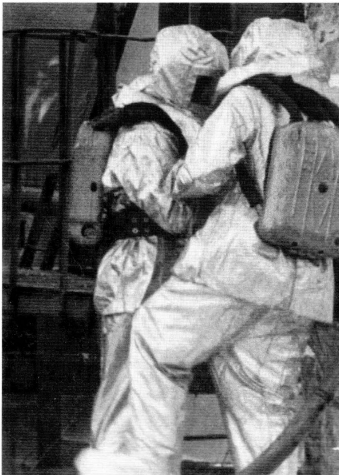
16 апреля 1923 г. Московская пожарная команда была награждена орденом Трудового Красного Знамени — высшим в то время знаком отличия, установленным для работников