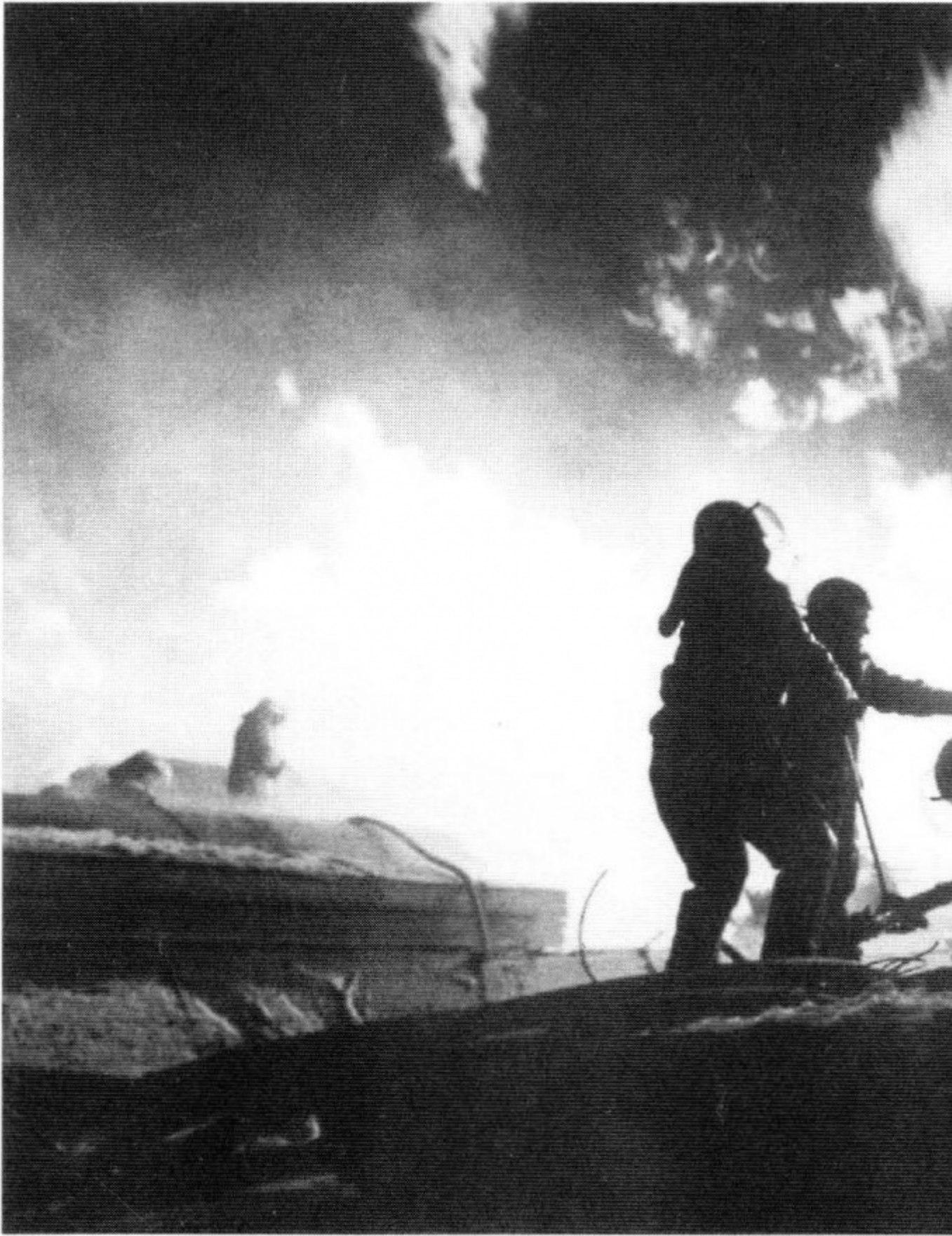
Весна 1918 г. в Москве выдалась ранняя. Пожарные столицы с облегчением встретили наступление теплой благодатной погоды — меньше стали досаждать пожары от свечей, коптилок и железных печей-«буржук», дымные трубы которых выглядывали из окон